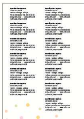
Datos del expositor