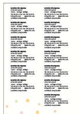
Datos del expositor