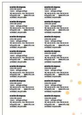
Datos del expositor